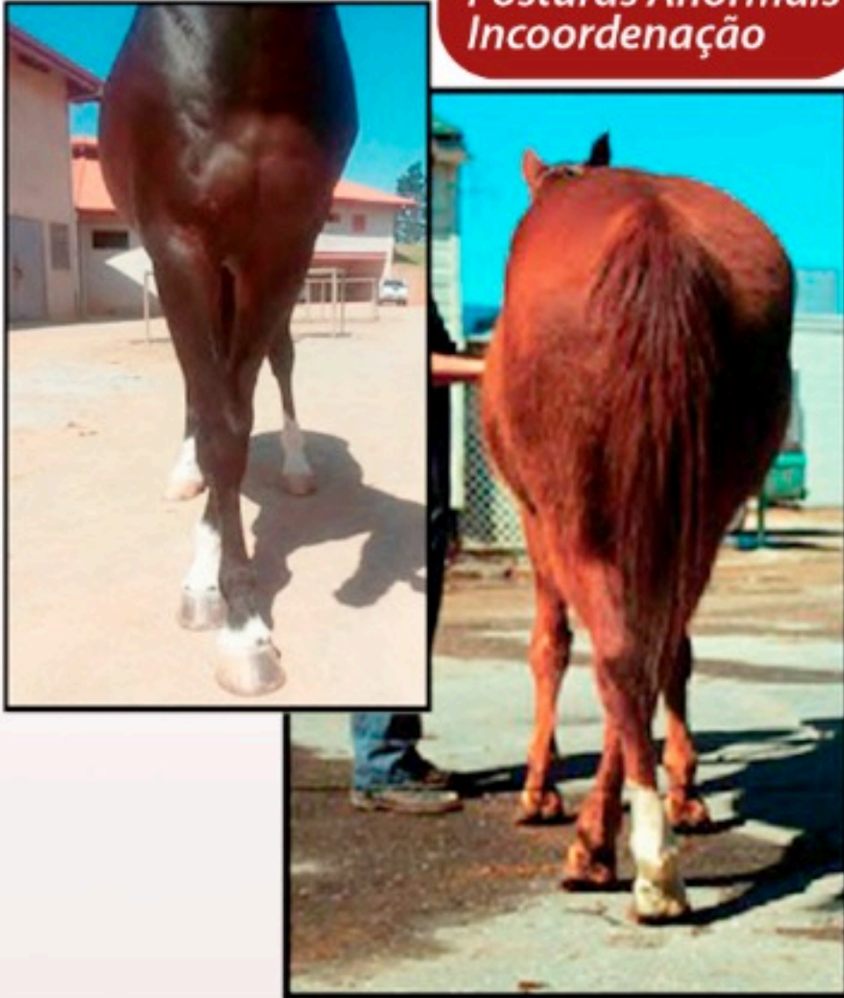
Posturas Anormais Incoordenação